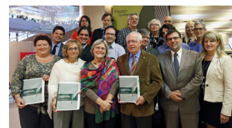
Les membres de la Commission pour l'éducation des adultes et la formation continue du Conseil supérieur de l'éducation

Un engagement collectif pour maintenir et rehausser les compétences en littératie des adultes : tel est l'essentiel du message livré par le Conseil supérieur de l'éducation dans le titre de l'avis. Il lance ainsi un appel à la mobilisation concertée des pouvoirs publics, des milieux du travail, de la santé, de la culture et de l'éducation ainsi que du milieu communautaire. Pour lire le texte intégral, cliquez ici .